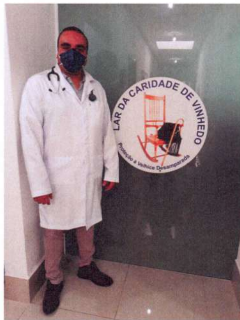
Profissionais da área de Saúde