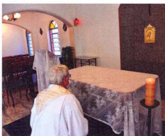
Capela da Instituição – Pe Norberto