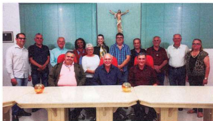
Diretoria – Triênio 27/06/2019 a 26/06/2022

Ela executa os projetos elaborados pela equipe técnica da Entidade, priorizando as maiores necessidades de acordo com os recursos financeiros.