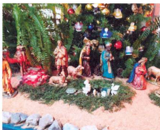
Presépio no refeitório dos idosos